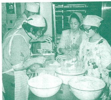
イーハトーフ風工房でのパンづくり

パン作りにも随分慣れてきた風工房のメンバーたち。「毎日でも食べたい」と評判のパンをもっと本格的に作るため、東淀川区上新庄にある